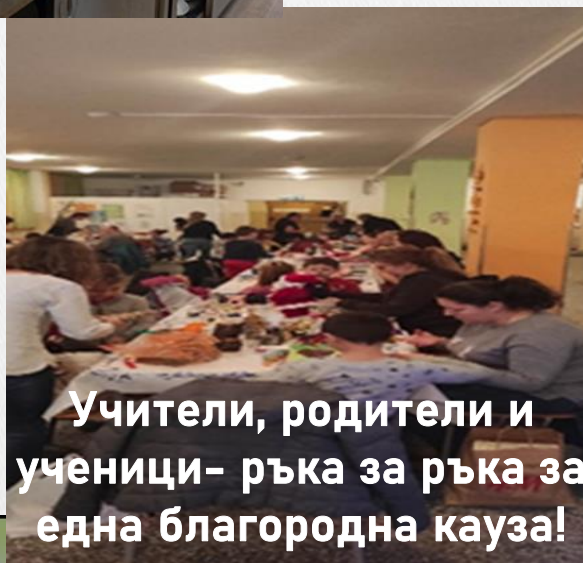
Учители, родители и ученици - ръка за ръка за една благородна кауза!