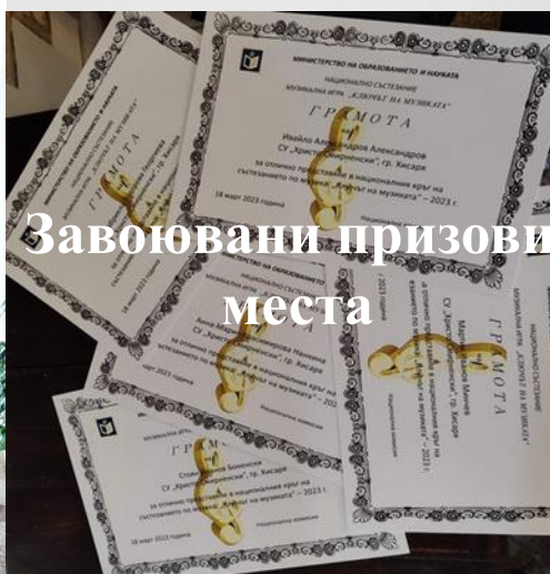
Завоювани призови места