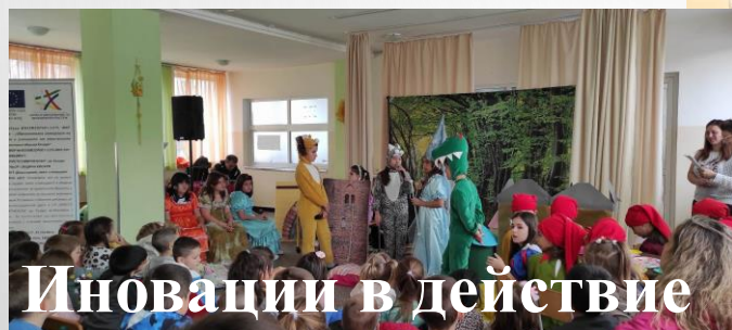
Иновации в действие